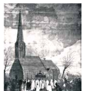
Peinture représentant la procession en l'honneur du miracle, Institut Meertens