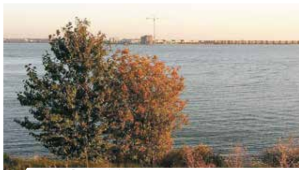
Vue du fleuve Schelda