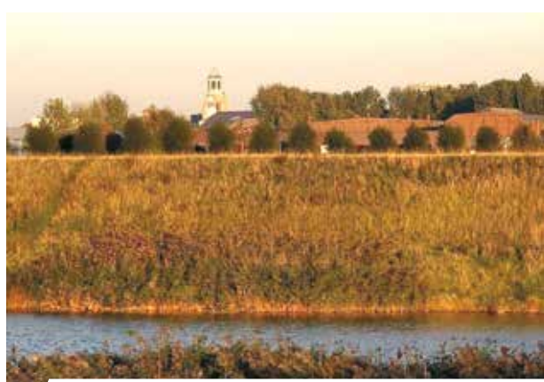
L'église Saints-Pierre-et-Paul et le fleuve Schelda