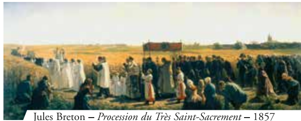
Jules Breton – Procession du Très Saint-Sacrement – 1857

La ville de Bergen est connue non seulement pour ses innombrables canaux, mais surtout pour un miracle eucharistique advenu en 1421. Depuis plusieurs mois le curé de l'église Saints-Pierre-et-Paul avait des doutes sur la présence réelle du corps et du sang du Christ dans l'Eucharistie. Le prêtre ne manifestait aucune dévotion envers le Très Saint-Sacrement. Un jour, après avoir dit la messe, il prit les hosties qui étaient restées et les jeta dans l'eau du canal. Après quelques mois les hosties furent retrouvées flottant sur l'eau et imprégnées de sang.