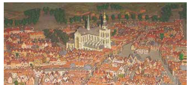
Vue d'une maquette de la ville de Bergen à l'époque du prodige

la mémoire. Au XX e siècle le culte a été rétabli et de nombreuses initiatives populaires sont organisées en souvenir du prodige.