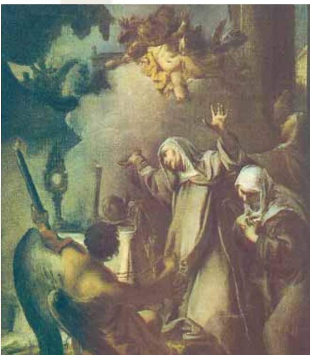
Le tableau représente Sainte Francesca Romana avec des compagnes extasiées d'admiration devant un ostensorio duquel sortent des lueurs lumineuses – Pordenone (Museo civico d'arte)

L a bienheureuse Angela da Foligno raconte qu'une fois dans l'Hostie elle vit le Christ sous l'aspect d'un garçon, très grand et majestueux comme un roi. Il semblait qu'assis sur un trône il tenait dans sa main quelque chose comme un signe de commandement [...] quand les autres se mirent à genoux, moi je courus près de l'autel pour la contemplation. J'éprouvais ensuite un grand regret pour le fait que le prêtre avait placé l'Hostie trop rapidement sur l'autel.