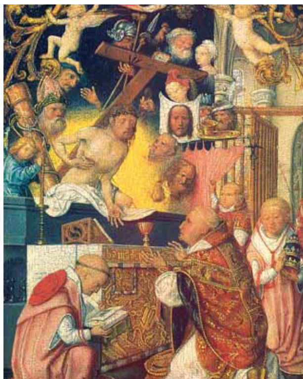
Une des messes miraculeuses de Saint Grégoire le Grand dans laquelle apparaît le Christ Crucifié (Tier, Musée diocésain)