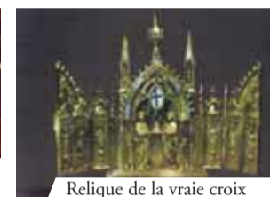
Relique de la vraie croix