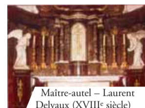
Maitre-autel – Laurent Delvaux (XVIII e siècle)