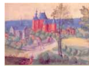
Tableau ancien du château et de l'abbaye de Bois-Seigneur-Isaac