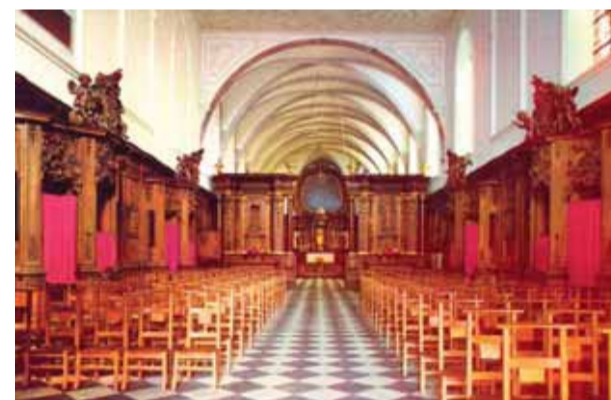
Intérieur de la chapelle du Saint-Sang