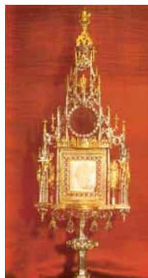
Relique du miracle eucharistique, le corporal taché de sang