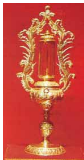
Relique d'une épine de la couronne de Jésus