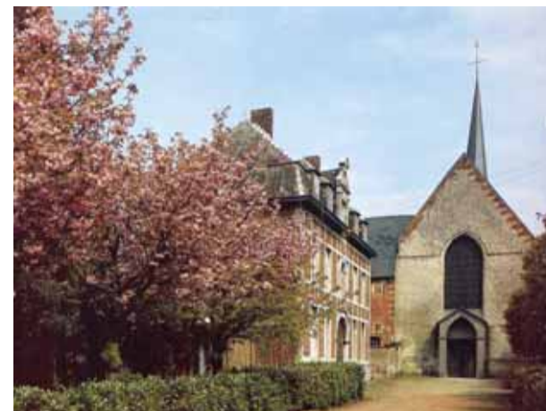
Abbaye des Prémontrés – Chapelle du Saint-Sang