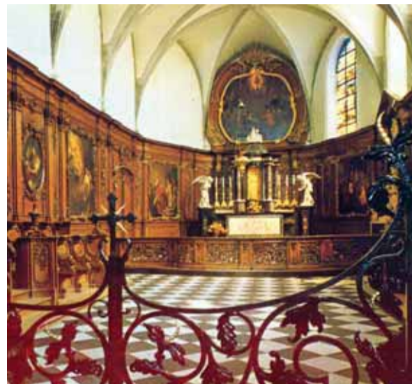
Chœur de la chapelle du Saint-Sang

Dans le miracle eucharistique de Bois-Seigneur-Isaac, l'hostie consacrée saigna et tacha le corporal de la messe. Le 3 mai 1413, l'évêque de Cambrai, Pierre d'Ailly, autorisa le culte de la sainte relique du miracle. La première procession eut lieu en 1414. Le 13 janvier 1424, le pape Martin V approuva officiellement la construction du monastère de Bois-Seigneur-Isaac. Aujourd'hui encore, le monastère est un but de pèlerinages et dans sa chapelle on peut vénérer la sainte relique du corporal taché de sang.