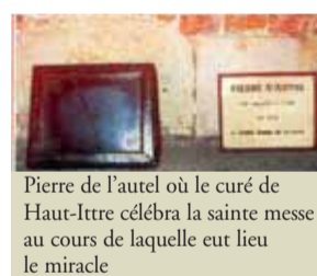
Pierre de l'autel où le curé de Haut-Ittre célébra la sainte messe au cours de laquelle eut lieu le miracle